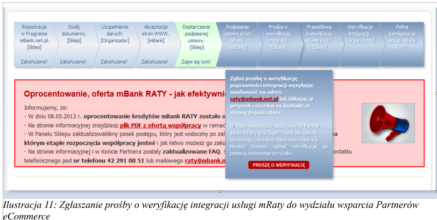
Ilustracja 11: Zgłaszanie prośby o weryfikację integracji usługi mRaty do wydziału wsparcia Partnerów eCommerce

przez Organizatora celem uruchomienia pełnej funkcjonalności systemu. Prośbę o weryfikację można zgłosić klikając w przycisk „Proszę o weryfikację” na odpowiednim kroku w Pasku statusu Partnera.