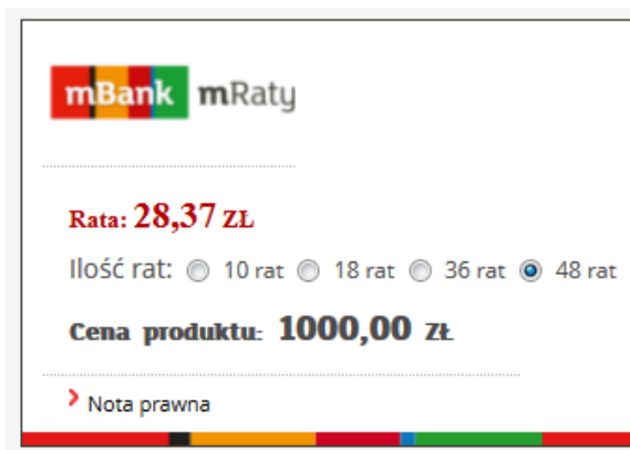
Ilustracja 4: Przykład kalkulatora Calc2

Kalkulator na podstawie przekazanych parametrów i wybranej na kalkulatorze ilości rat prezentuje wyliczoną ratę kredytu. Kalkulator wyświetlany jest w postaci graficznej w orientacji poziomej. W celu udostępnienia klientowi kalkulatora, Partner powinien wstawić w źródło swojej strony poniższy kod: