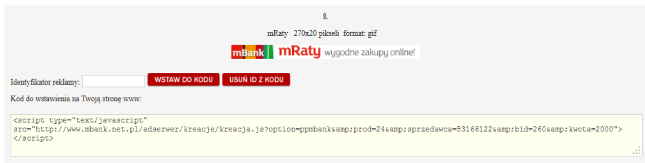
Ilustracja 1: Przykład materiału promującego usługę mRaty

Odszukaj na stronie kreację, którą chcesz umieścić na swojej stronie.