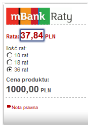
Ilustracja 2: Przykład kalkulatora Calc1

Kalkulator na podstawie przekazanych parametrów i wybranej na kalkulatorze ilości rat prezentuje wyliczoną ratę kredytu. Kalkulator wyświetlany jest w postaci graficznej w orientacji pionowej. W celu udostępnienia klientowi kalkulatora, Partner powinien wstawić w źródło swojej strony poniższy kod: