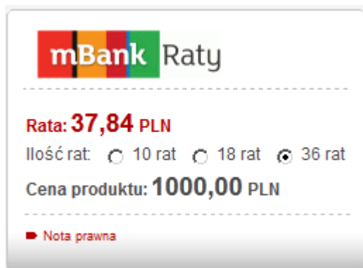
Ilustracja 4: Przykład kalkulatora Calc2

Kalkulator na podstawie przekazanych parametrów i wybranej na kalkulatorze ilości rat prezentuje wyliczoną ratę kredytu. Kalkulator wyświetlany jest w postaci graficznej w orientacji poziomej. W celu udostępnienia klientowi kalkulatora, Partner powinien wstawić w źródło swojej strony poniższy kod: